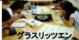
グラスリッツエン