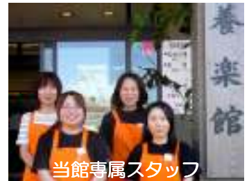
当館専属スタッフ